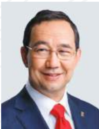
Айсен НИКОЛАЕВ, Глава Якутии

Aisen NIKOLAEV, Head of the Sakha Republic (Yakutia)