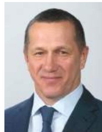
Юрий ТРУТНЕВ, Заместитель Правительства РФ, Полномочный представитель Президента РФ в ДФО

The games «Children of Asia» gathered in Yakutsk more than 3 thousand young athletes from 24 countries. This is a great opportunity for you to prove yourself, demonstrate everything that you have gained over the years of training, gain new experience, make acquaintances with people from different parts of the world and our big country...»