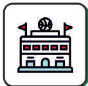
Other sports facilities