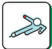
Sports arenas, Ice rinks